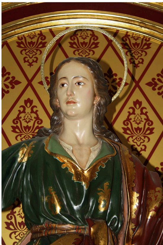
Fotografía de Beatriz Segura